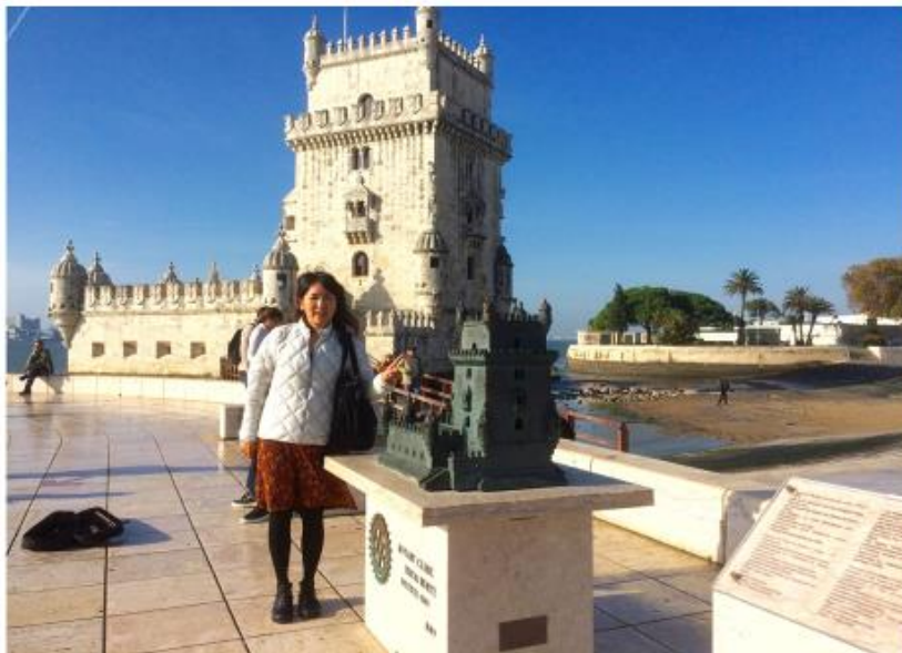
世界遺産 ポルトガル ベレンの塔

この度は、建長寺ブロンズ模型プロジェクトへのご賛同、誠に有難うございます。 お心を寄せていただきましたこと、心より感謝申し上げます。